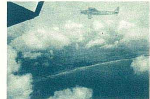
Kjöge på Själland

Kl. 8.30 startar flygplanet från Malmö. Öresund passeras på några minuter, efter mellanlandning i Köpenhamn sätter föraren kurs rakt på Amsterdam. Scenerierna växla: de lummiga danska öarna, lågländet vid Schleswig, tyska Nordsjökusten, Friesland, Zuyderzee med öarna Urk och Marken, så kommer Amsterdam i sikte och flygplanet landar i flyghamnen vid Schiphol. Efter 45 minuters uppehåll för lunch på den utmärkta restauranten fortsätta passagerarna. Till Rotterdam går färden sedan över ett typiskt holländskt landskap med byar, blomsterfält och kanaler vid vilka pittoreska väderkvarnar skymta fram. Maskinen till London följer sedan kusten förbi Ostende och Dunkerque. Vid Calais passeras kanalen och 7 timmar efter avfärden från Malmö sker