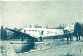
Junkers flygplan för 12 passagerare

Ännu större är tidsvinsten om man reser från Stockholm till Helsingfors med det nya flygplanet för 12 passagerare. Starten från Stockholm är kl. 10.00. Färden går över den vackra skärgården till Söderarm. Ålandshav passerar på 10 minuter, så möter den finska skärgården. Under sommaren mellanlandar flygplanet i Åbo och styr där efter över de glittrande insjöarna till Helsingfors. Hela resan tar endast omkring två timmar — en tidsvinst för de resande av 19 timmar.