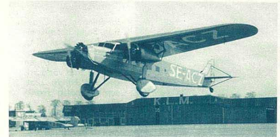
Aerotransports Fokker landar i Schiphol

De yppersta flygplan trafikera de svenska routerna. Den tekniska utrustningen är på toppen av utvecklingen. Tillförlitliga motorer driva maskinerna framåt och med ledning av instrument flyger föraren obehindrat genom molnen. Under färden uppehåller radiotelegrafisten ombord förbindelse med flygstationerna och andra maskiner på routen, mottager väderleksmeddelanden och kontrollerar kursen med pejlstationerna. (Telegrafisten på de svenska flygplanen får även befordra telegram