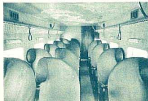
Interiör av Fokker F XII

»För att flyget skall bli populärt måste maskinerna bli bekvämare» yttrade en känd Paris-resenär för några år sedan. »Nu är det verkligen tip-top att flyga» yttrade samma person, när han rest med den nya svenska Fokkern. Stolarna äro mjuka och rymliga, väggarna i salongen ljudisolerade, ventilationen utmärkt och värmeledningen håller luften konstant vid rumstemperatur.