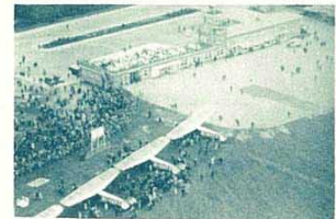
Schiphol vid Amsterdam