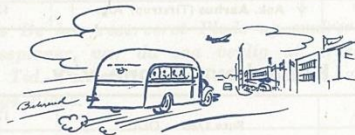
Tegnforklaring og Forkortelser: Se Side 12.

Paris: AF, Gare des Invalides (90). Praha: CSA, Vodickova ulice 34 (90). Reykjavik: FLUGFELAG ISLANDS, Lækjargötu 4 (60). Roma: AVIO LINEE, Via Regina Elena 63 (90). Stockholm: ABA, Flygpaviljongen, Nybroplan (60). Rute 1623 (75). Teheran: Levantour, Maidan Ferdowey (90). Zürich: SWISSAIR, Hauptbahnhof, Hauptportal (60).